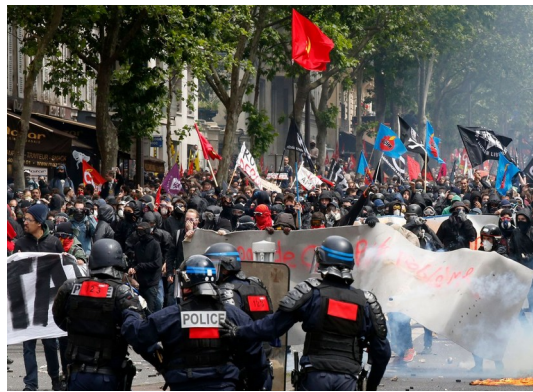
Blocage policier de la manifestation ouvrière massive et violente du 14 juin à Paris.

Pour les minorités communistes, il est temps d'en finir avec les hésitations quant à la capacité révolutionnaire du prolétariat face aux enjeux de la situation qui s'ouvre. La perte de confiance dans la perspective révolutionnaire qui a touché