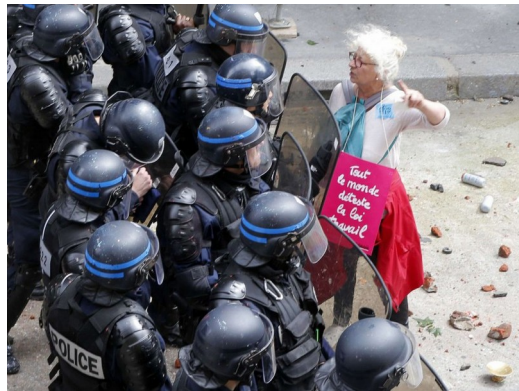
"Jeune casseur black-bloc" du "cortège de tête" – devant et "hors" les syndicats – face à la police dans les manifestations...

peut-être la plus violente du fait des provocations incessantes de la police – qui va jusqu'à bloquer le cortège en plusieurs points parfois jusqu'à 1 heure provoquant ainsi des affrontements incessants. Utilisant les incidents et violences que sa police a elle-même provoqués 6 , le gouvernement décide d'interdire les manifestations dans un premier temps, puis de restreindre leur parcours et leur accès par un quadrillage policier complet. Petit à petit, les dernières grèves s'épuisent, le relais tant attendu et si nécessaire à partir des lieux de production ne parvenant pas, euro de football et vacances d'été approchant, la mobilisation se termine par une